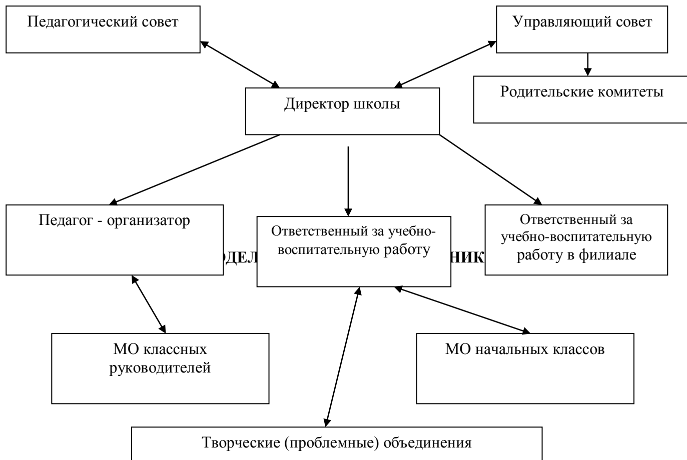
Схема управления образовательным учреждением